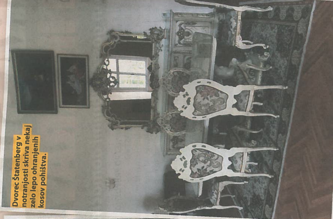
Dvorec Štatenberg v notranjosti skriva nekaj zelo lepo ohranjenih kosov pohištva.